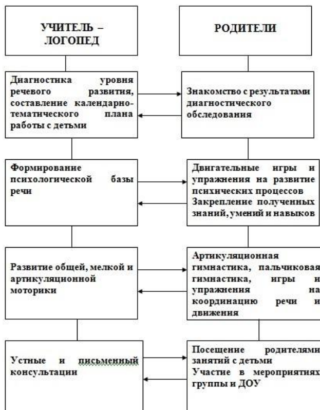
МОДЕЛЬ ВЗАИМОДЕЙСТВИЯ УЧИТЕЛЯ-ЛОГОПЕДА С РОДИТЕЛЯМИ

Без постоянного и тесного взаимодействия с семьями воспитанников коррекционная логопедическая работа будет не полной и не достаточно эффективной. Поэтому интеграция детского сада и семьи – одно из основных условий работы учителя-логопеда на логопедическом пункте ДОО. Модель взаимодействия с семьями детей, имеющими нарушения речи, представлена на